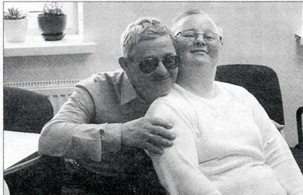
Jak pomóc niepełnosprawnym w poruszaniu się po rynku pracy – tego m.in. będzie dotyczyć czerwcową konferencja